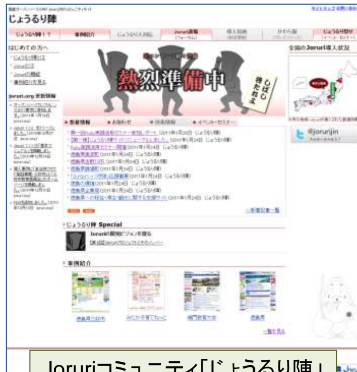
Joruriコミュニティ「じょうり陣」