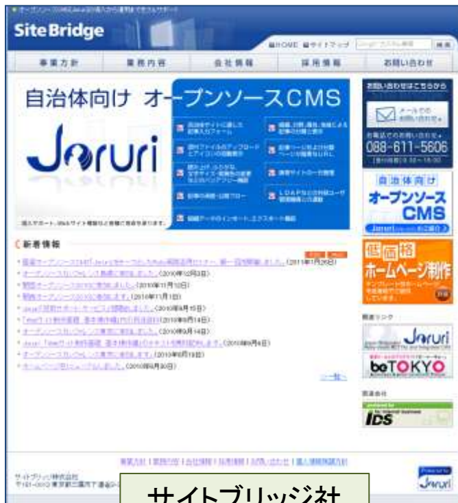
サイトブリッジ社