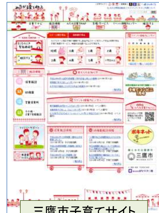
三鷹市子育てサイト